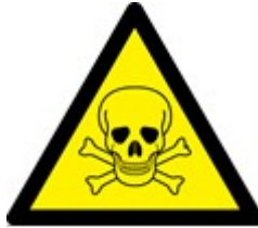
Toksik (Zehirli) Madde