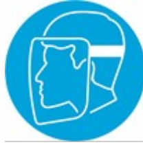
Yüz Siperi Kullan