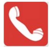
Acil Yangın telefonu