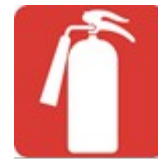
Yangın Söndürme Cihazı