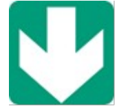
Yönler (Yardımcı Bilgi İşareti)