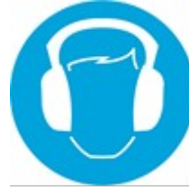
Kulak Koruyucu Tak