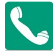
Acil Yardım ve İlk Yardım Telefonu

5- Yangınla Mücadele İşaretleri; Dikdörtgen veya kare biçiminde, Kırmızı zemin üzerine beyaz piktogram (kırmızı kısımlar işaret alanının en az % 50'sini kapsayacaktır)