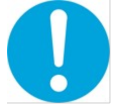
Genel emredici işaret (gerektiğinde başka işaretle birlikte kullanılacaktır)

4- Acil Çıkış ve İlk Yardım İşaretleri; Dikdörtgen veya kare biçiminde, Yeşil zemin üzerine beyaz piktogram (yeşil kısımlar işaret alanının en az %50'sini kapsayacaktır)