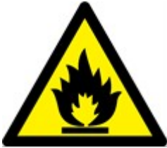
Parlayıcı Madde Veya Yüksek ısı

2- Uyarıcı İşaretler; Üçgen şeklinde, sarı zemin üzerine siyah piktogram, siyah çerçeve (sarı kısımlar işaret alanının en az % 50’sini kapsayacaktır)