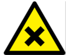
Zararlı veya Tahriş Edici Madde

3- Emredici İşaretler; Daire biçiminde, Mavi zemin üzerine beyaz piktogram (mavi kısımlar işaret alanının en az %50’sini kapsayacaktır)