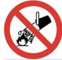
Suyla Söndürmek Yasaktır.

2- Uyarıcı İşaretler; Üçgen şeklinde, sarı zemin üzerine siyah piktogram, siyah çerçeve (sarı kısımlar işaret alanının en az % 50’sini kapsayacaktır)