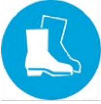
İş Ayakkabısı Giy