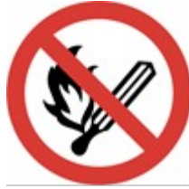
Sigara İçmek ve Açık Alev Kullanmak Yasaktır.